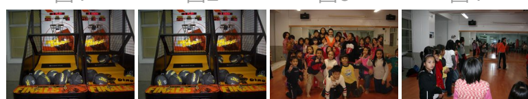
圖5 圖6 圖7 圖8