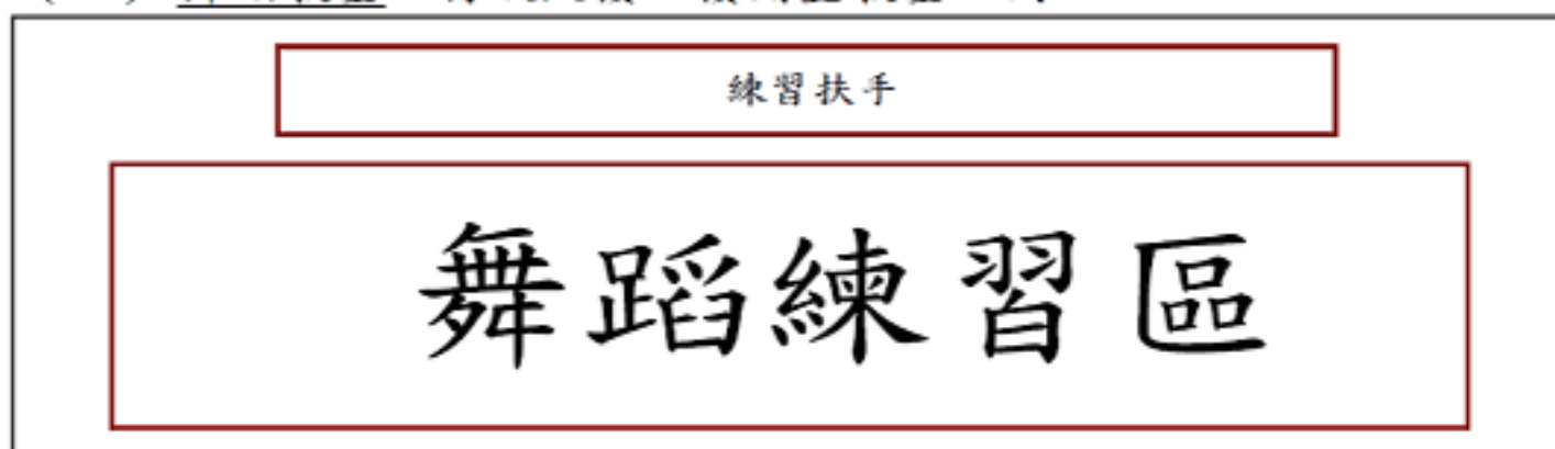
舞蹈教室平面圖:尺寸長 9 公尺 50 公分、寬 8 公尺 30 公分