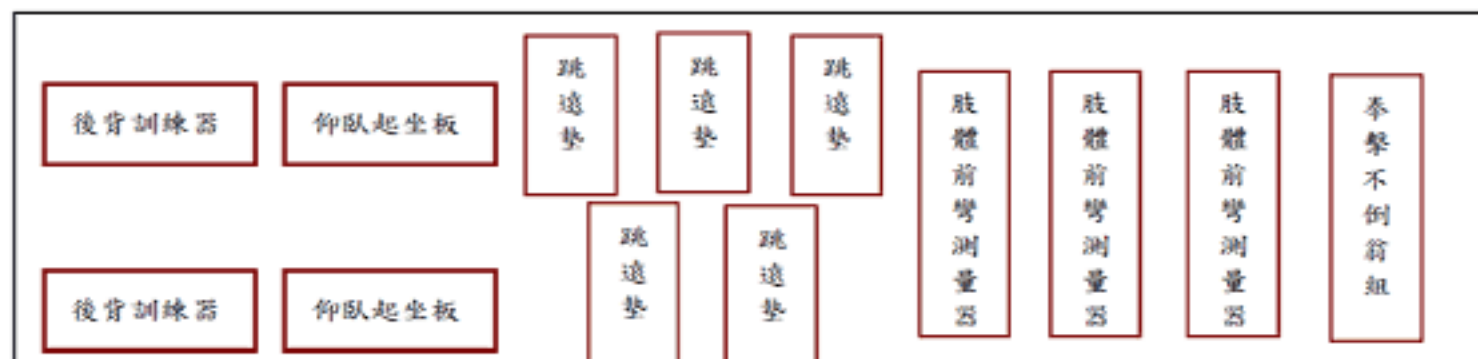
體適能教室平面圖：尺寸長 8 公尺 50 公分、寬 4 公尺 70 公分