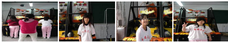
圖17 圖18 圖19 圖20