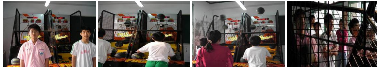
圖21 圖22 圖23 圖24