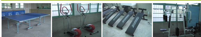
圖2 圖3 圖4