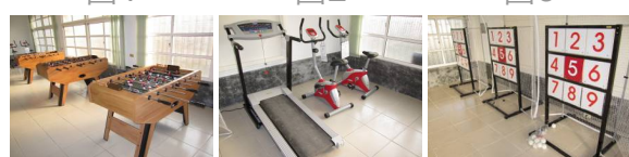
圖5 圖6 圖7