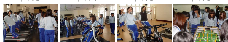
圖17 圖18 圖19 圖20