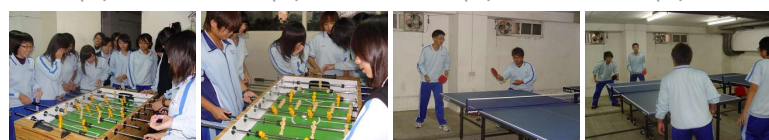
圖9 圖10 圖11 圖12