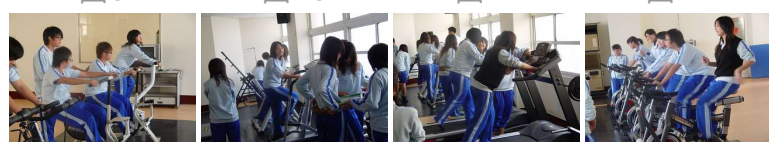
圖13 圖14 圖15 圖16