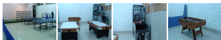
圖9 圖10 圖11 圖12