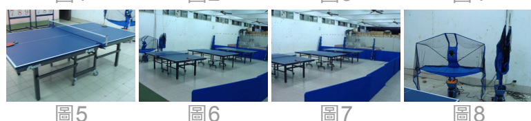
圖5 圖6 圖7 圖8