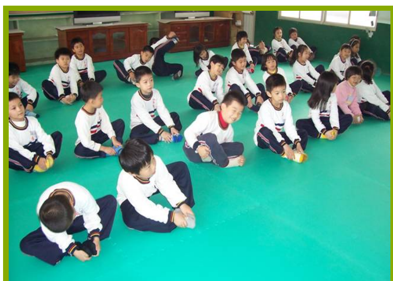
圖1：韻律教室設有電視、鋪上舒服的軟墊