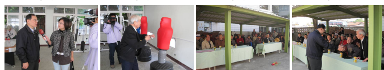
圖5 圖6 圖7 圖8