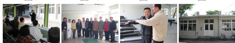
圖13 圖14 圖15 圖16