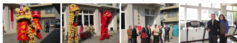
圖9 圖10 圖11 圖12