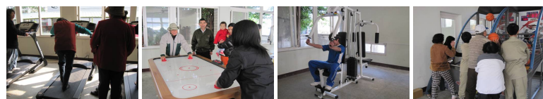
圖2 圖3 圖4