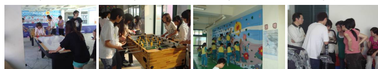
圖4 圖5 圖6 圖7 圖8