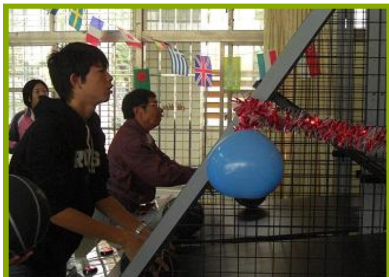
圖1：本校樂活運動站簡介