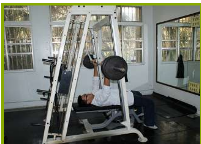
圖1：本校樂活運動站簡介