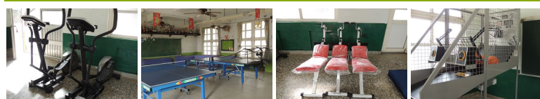
圖2 圖3 圖4