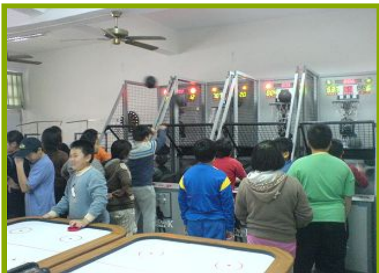
圖1：學生使用樂活站運動器材