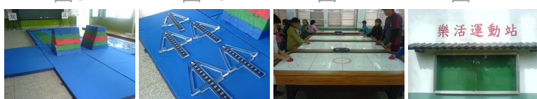
圖13 圖14 圖15 圖16