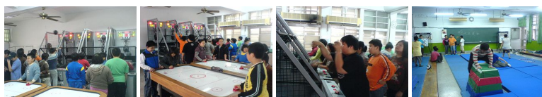
圖1 圖2 圖3 圖4