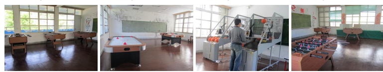
圖13 圖14 圖15 圖16