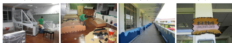
圖9 圖10 圖11 圖12