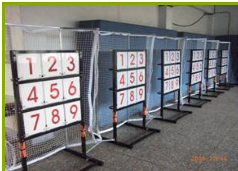
圖1：棒球教室平時擺放情形