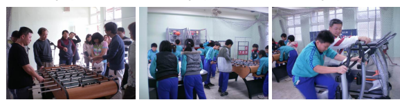
圖5 圖6 圖7