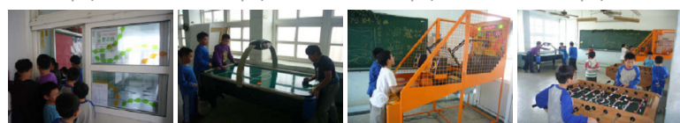
圖8 圖9 圖10 圖11 圖12