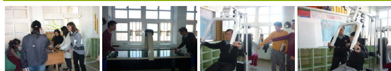
圖2 圖3 圖4