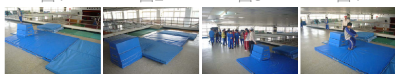
圖5 圖6 圖7