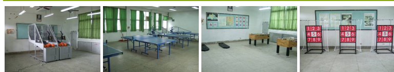
圖2 圖3 圖4