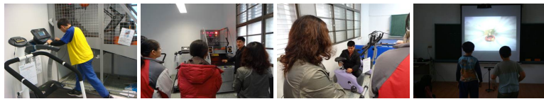
圖1 圖2 圖3 圖4