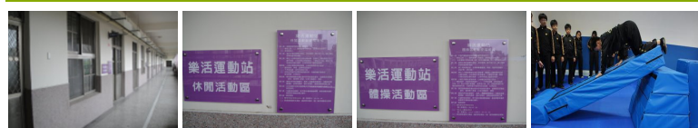
圖1 圖2 圖3 圖4