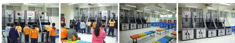
圖5 圖6 圖7 圖8