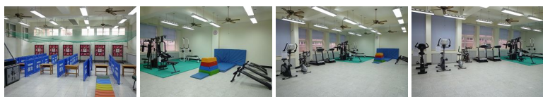
圖9 圖10 圖11 圖12