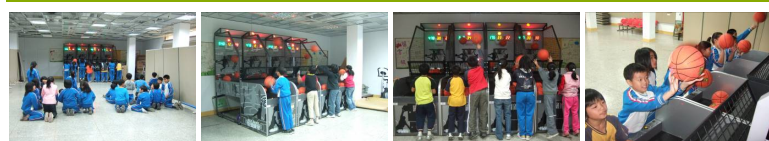
圖1 圖2 圖3 圖4