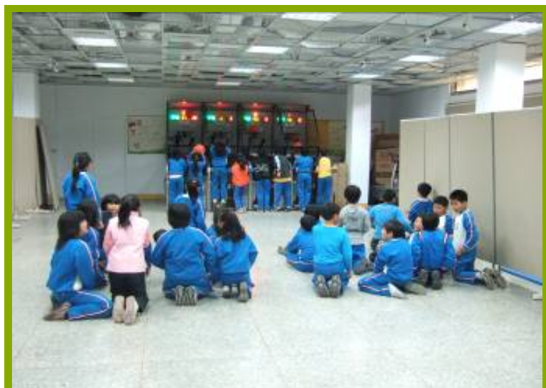
圖1：分組雙人投籃接力賽