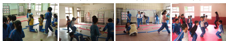
圖9 圖10 圖11 圖12