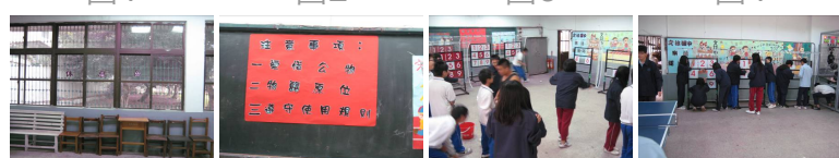
圖5 圖6 圖7 圖8