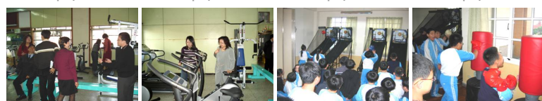
圖9 圖10 圖11 圖12