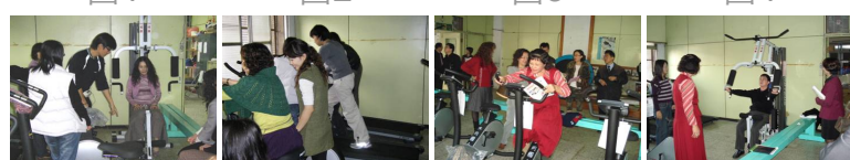
圖5 圖6 圖7 圖8