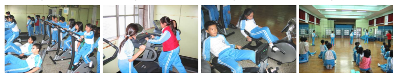
圖13 圖14 圖15 圖16