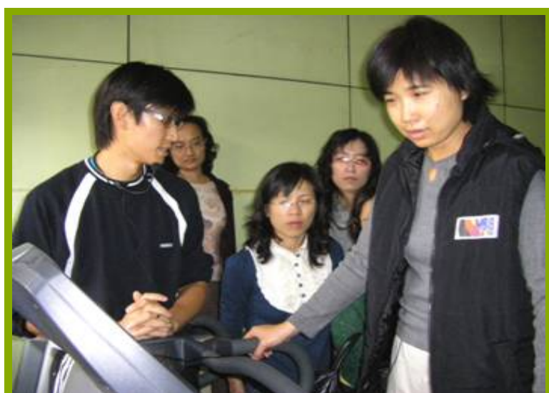
圖1：學校師生使用運動站情況