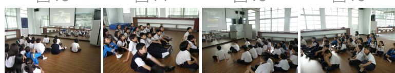
圖17 圖18 圖19 圖20