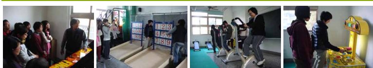
圖1 圖2 圖3 圖4