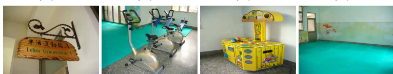
圖9 圖10 圖11 圖12