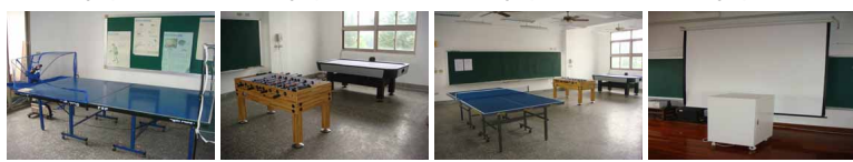
圖13 圖14 圖15 圖16