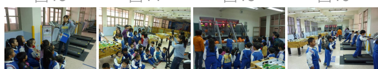
圖17 圖18 圖19 圖20