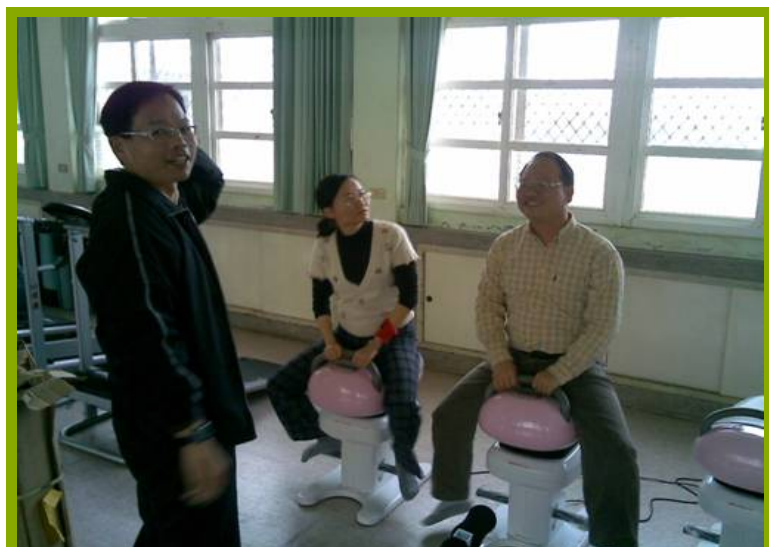
圖1：教師使用騎馬器情況