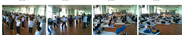
圖13 圖14 圖15 圖16