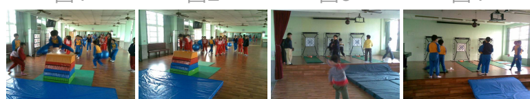
圖5 圖6 圖7 圖8