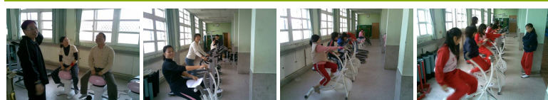
圖2 圖3 圖4