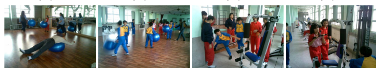
圖9 圖10 圖11 圖12