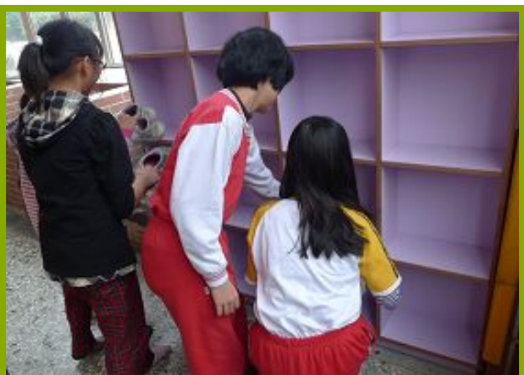
圖1：更衣淋浴間設施