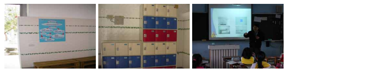
圖17 圖18 圖19