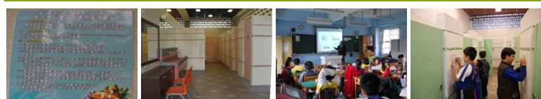
圖2 圖3 圖4