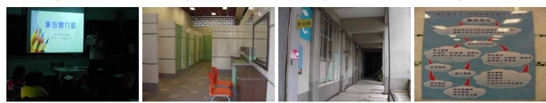
圖13 圖14 圖15 圖16