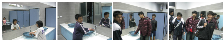
圖5 圖6 圖7 圖8