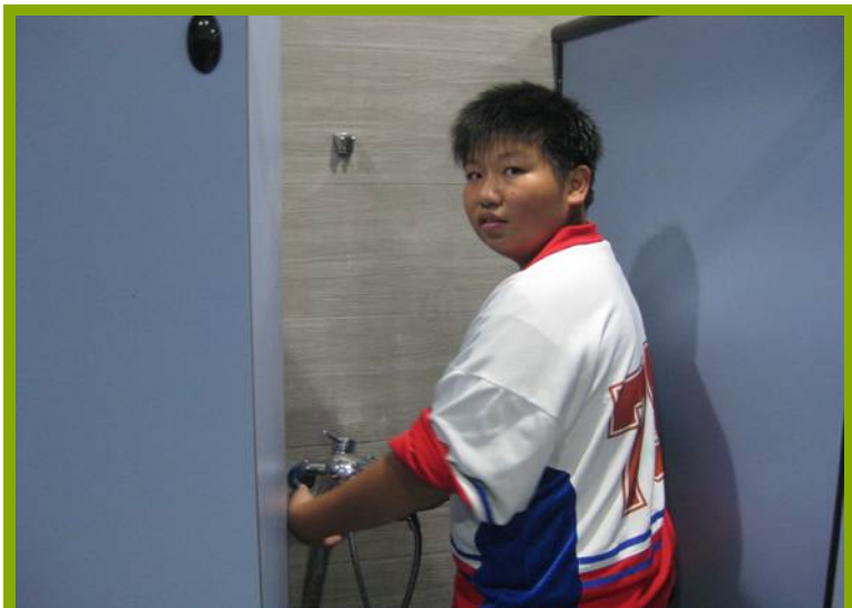
圖1：更衣淋浴間設施