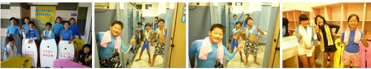
圖9 圖10 圖11 圖12