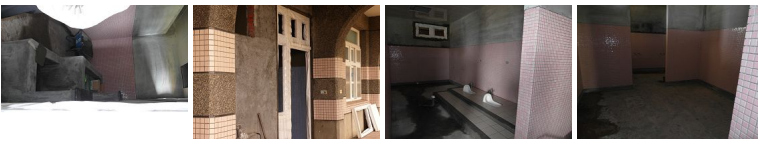
圖17 圖18 圖19 圖20