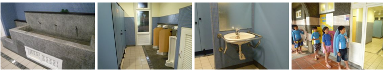
圖2 圖3 圖4