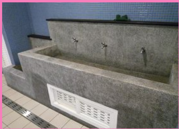
圖1：學生體驗更衣淋浴間設施