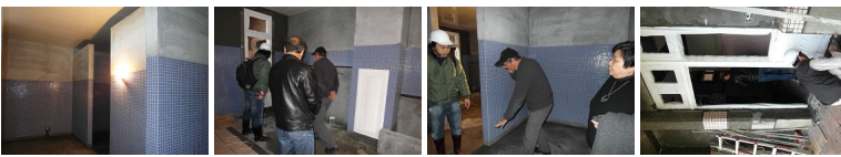
圖13 圖14 圖15 圖16