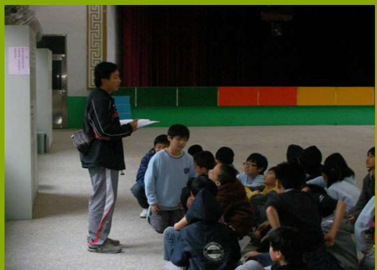
圖1：學生體驗樂活設施