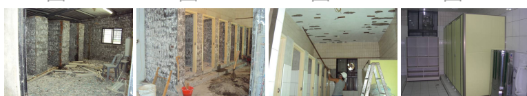
圖21 圖22 圖23 圖24