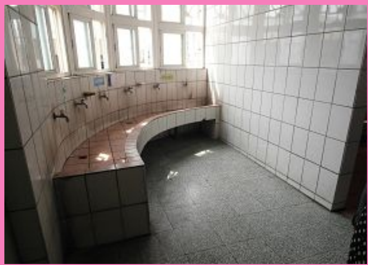
圖1：學生體驗更衣淋浴間設施