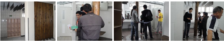
圖21 圖22 圖23 圖24