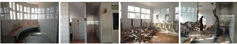
圖13 圖14 圖15 圖16