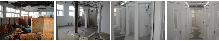
圖17 圖18 圖19 圖20