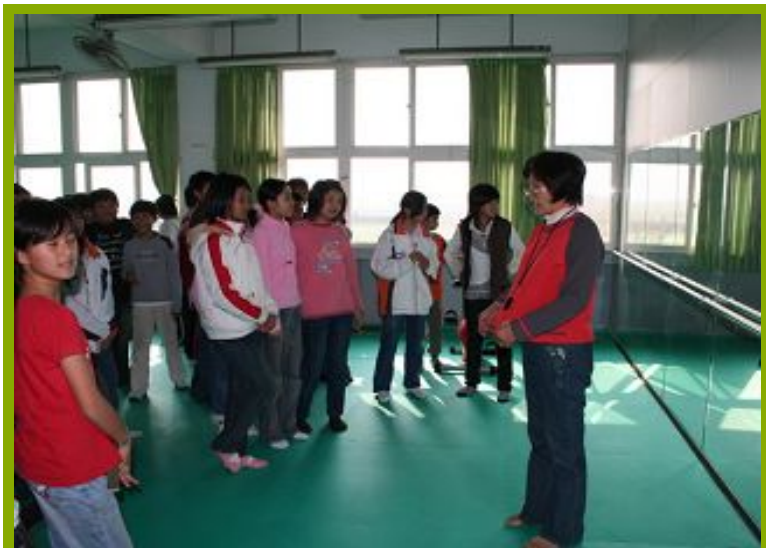
圖1：學生體驗樂活設施