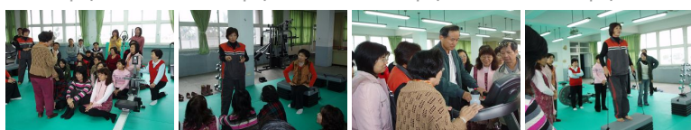
圖9 圖10 圖11 圖12