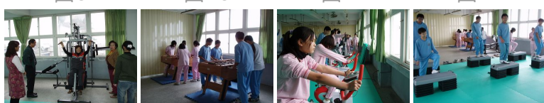
圖13 圖14 圖15 圖16