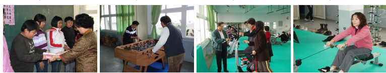
圖5 圖6 圖7 圖8