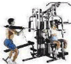
四人是重量訓練機