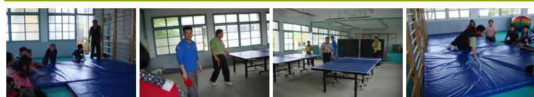
圖1 圖2 圖3 圖4