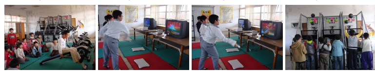
圖13 圖14 圖15 圖16