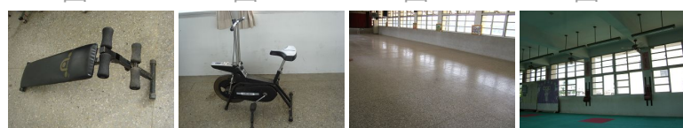
圖21 圖22 圖23 圖24