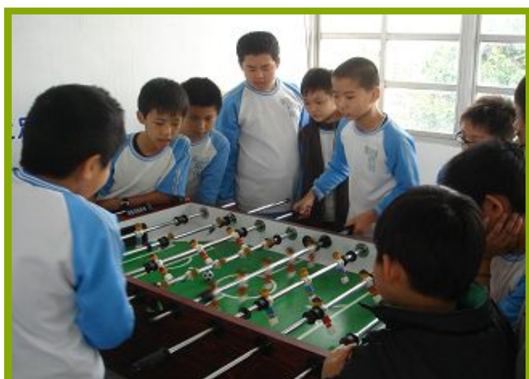
圖1：學生使用手足球機器材情況