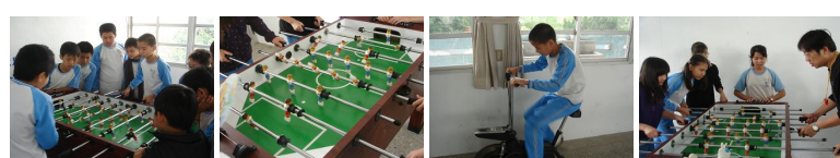
圖1 圖2 圖3 圖4