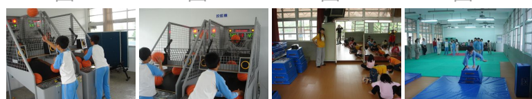
圖5 圖6 圖7 圖8