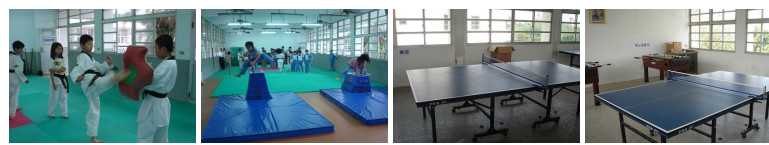
圖13 圖14 圖15 圖16