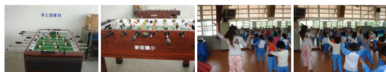
圖17 圖18 圖19 圖20