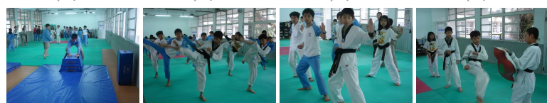
圖9 圖10 圖11 圖12