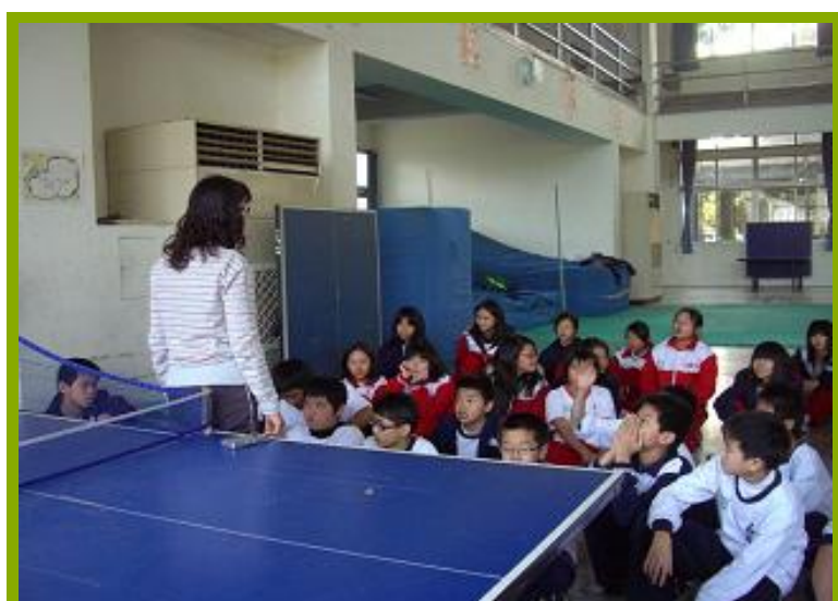
圖1：學生體驗樂活設施