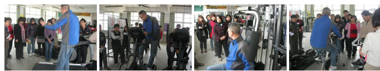
圖1 圖2 圖3 圖4