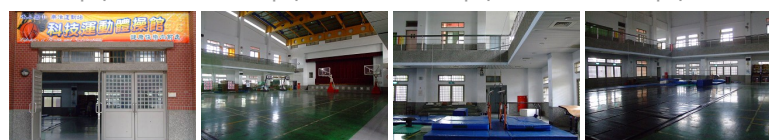
圖9 圖10 圖11 圖12