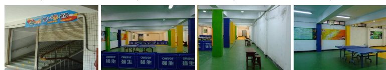
圖5 圖6 圖7 圖8