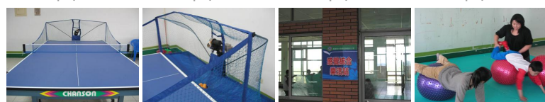
圖9 圖10 圖11 圖12