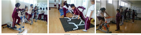
圖17 圖18 圖19