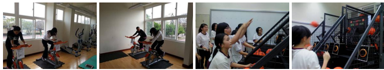
圖8 圖9 圖10 圖11 圖12