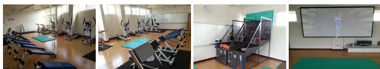
圖2 圖3 圖4