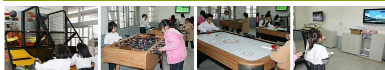
圖1 圖2 圖3 圖4