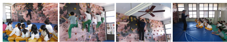
圖5 圖6 圖7 圖8