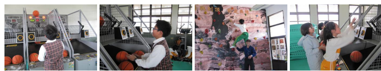
圖1 圖2 圖3 圖4