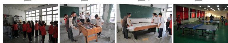
圖5 圖6 圖7 圖8