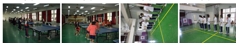
圖9 圖10 圖11 圖12