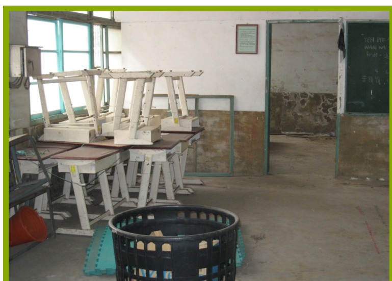
圖1：韻律教室施工前照片