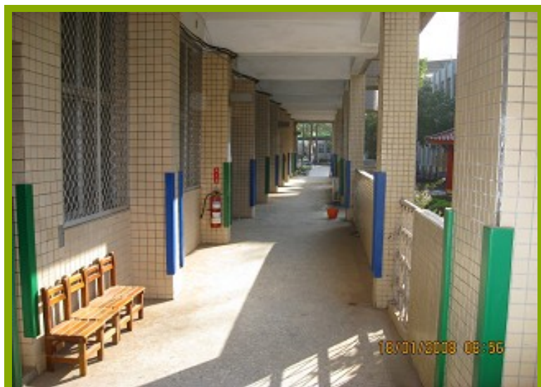
圖1：樂活運動站一角