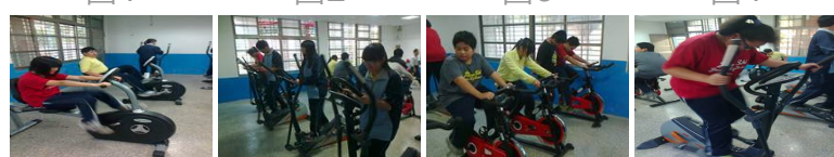
圖4 圖5 圖6 圖7 圖8